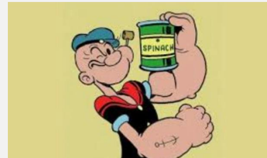
Popeye, obtenía su fortaleza al comer espinacas

Ahora pregúntale a tu hijo como obtiene fortaleza cuando descubre que ha actuado mal en contra del Señor. Dile que hay alguien que vive en nosotros que produce esa fortaleza, el Espíritu Santo. Él nos lleva a llorar por nuestros pecados y al mismo tiempo nos consuela dándonos seguridad de que hemos sido perdonados, y esa seguridad es la que nos fortalece cada día para enfrentar las pruebas de fe.