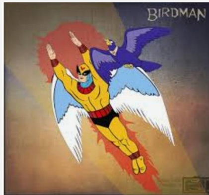
Birdman obtenía su fortaleza al acercarse al sol