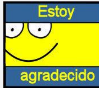
PORTADA DEL LIBRITO

MANUALIDAD OPCIONAL: Dile a tu hijo que va a colorear y crear un libro para recordar estar agradecido a Dios en vez de estar celoso de otros. Dale la página de colorear (ANEXO 1), crayolas o marcadores. Al terminar de colorear, ayúdale a cortar cada cuadrito en la página, estos serán las páginas del libro, luego engrápalas o únelas con cinta adhesiva. En la parte de atrás de cada página del libro pueden escribir o dibujar más cosas por las cuales está agradecido.