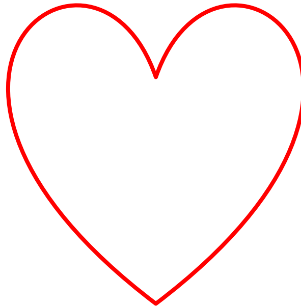
AMOR DEL SER HUMANO